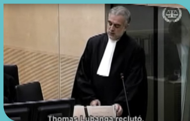
El juicio de Thomas Lubanga

película mexicana de 2004 dirigida por Luis Mandoki que transcurre durante la guerra civil salvadoreña en 1980