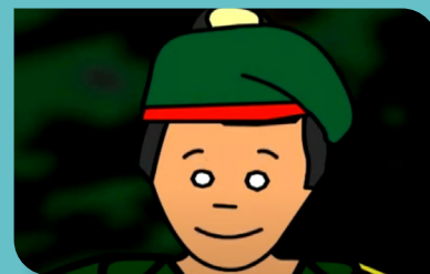
Reinventar el futuro

corto de la Cinemateca Distrital apoyado por OIM y Save the Children