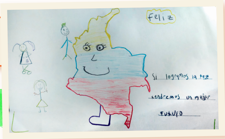
DANIEL 7 años Cundinamarca