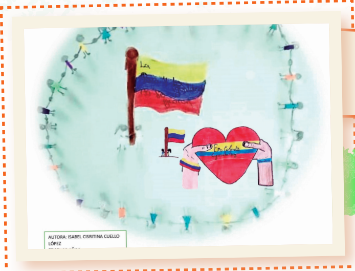
ISABEL 12 años Barranquilla