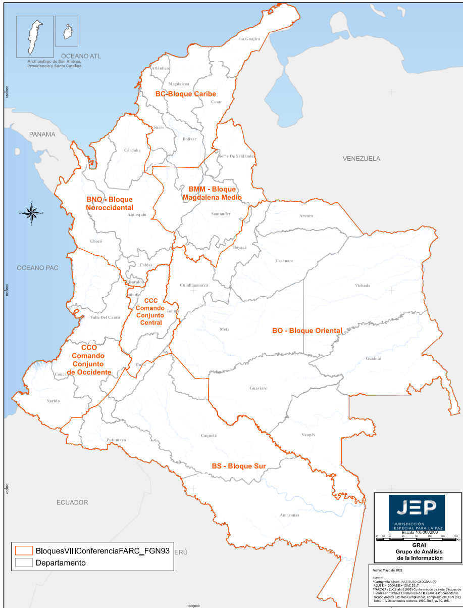
Ilustración 1. Zona e injerencia por bloque de las FARC - VIII Conferencia Nacional Guerrillera

líneas de mando relacionadas en función de las instancias de decisión, ejecución y control en materia de incorporación y vida intrafilas de niños y niñas reclutados por las FARC-EP. En la siguiente gráfica se aprecia la influencia territorial que tuvieron los bloques de la antigua guerrilla: