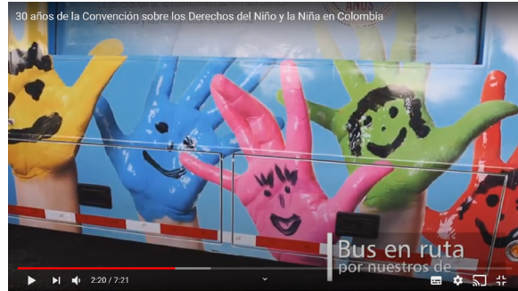
30 años de la Convención sobre los Derechos del Niño y la Niña en Colombia