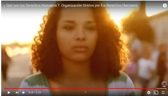
¿Qué son los Derechos Humanos ? Organización Unidos por los Derechos Humanos